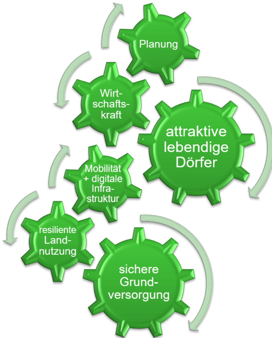
Abbildung 4: Zusammenspiel der Handlungsfelder in der ländlichen Entwicklung