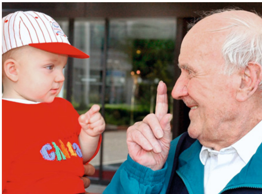
Der Zensus 2011 gibt auch Aufschluss über die Bevölkerungsstruktur Deutschlands.

Schutz und Vertraulichkeit der im Rahmen des Zensus erhobenen Daten haben höchste Priorität. „Das im Gesetz festgeschriebene Statistikgeheimnis schützt die Zensusdaten perfekt. Darauf kön-