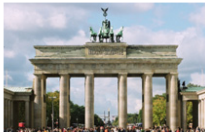
20 JAHRE DEUTSCHE EINHEIT 8