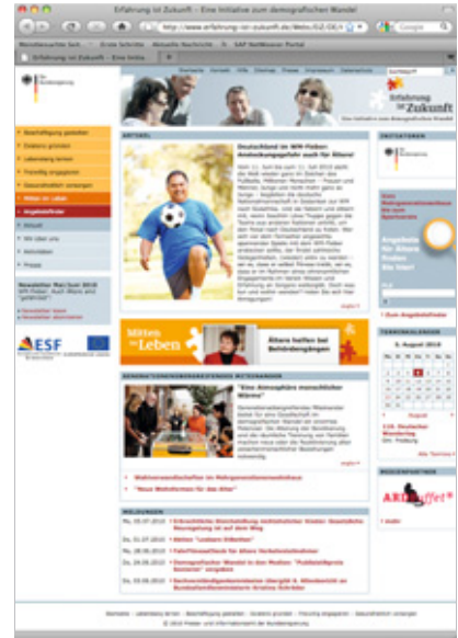
Die Website der Initiative www.erfahrung-ist-zukunft.de

>> Weitere Informationen zur Initiative finden Sie unter: www.erfahrung-ist-zukunft.de